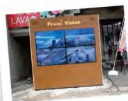
チャンスセンターの隣にあります。